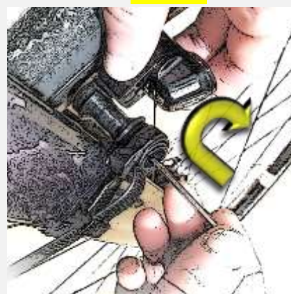
Lampe parallel zur Felge justieren & Arm festschrauben