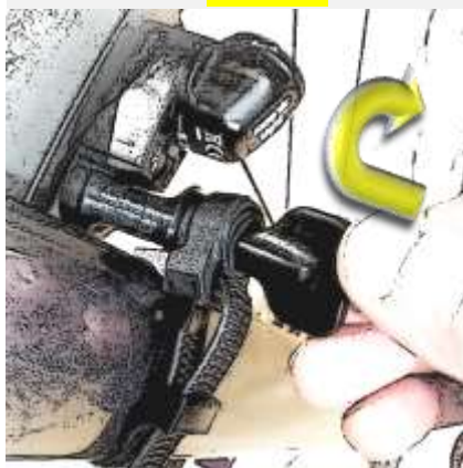
Ziehe Kunststoffschelle mit Spezial-Plastikschlüssel fest.