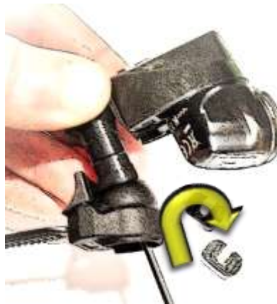
Arm wieder festschrauben