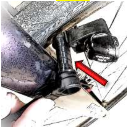
Gabel-Felgen-Abstand prüfen Arm zu lang? → Spacer entfernen