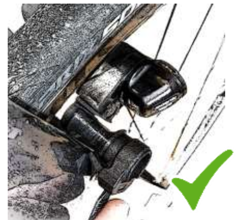
Abstand ok? → Dann zu Schritt 2