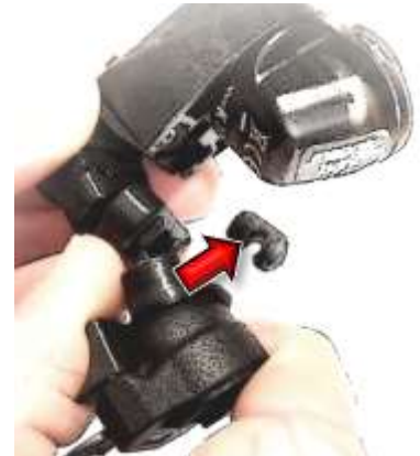
Falls erforderlich: 1/2/3 Spacer herausdrücken.