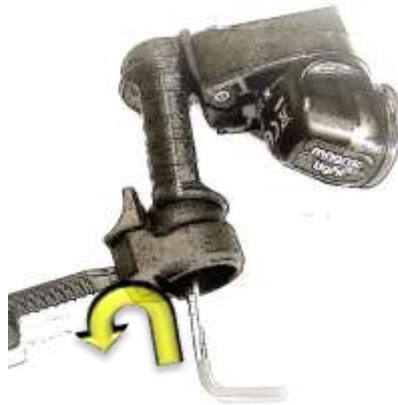
Arm mit großem Inbusschlüssel (3mm) lösen