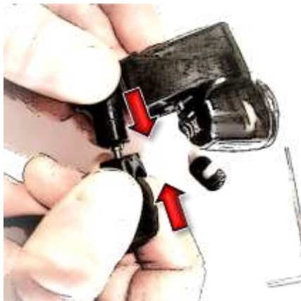
Beide Seiten zusammendrücken